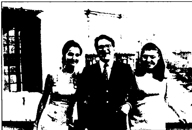
رؤمانو و له‌که‌ل دوو خوشکی خوی