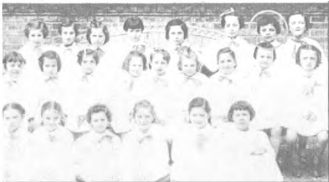
فلافیا به مندالی و له باخچی ساوایان