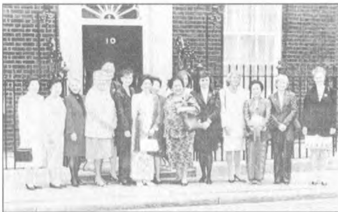
فلافیا له کتل هاوسه رهمکانی سهرانی په که تیی نه ورو یادا