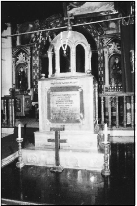
വി. ഗീവർഗീസ് സഹദായുടെ തിരുശേഷിപ്പ് ഉൾക്കൊള്ളുന്ന പേടകം

കേരളീയ സമൂഹത്തിന്റെ പൊതുവായ ഈ സർപ്പഭയം രണ്ടു രീതിയിലാണ് പ്രതിഫലിച്ചത്. ഹിന്ദു സമൂഹം സർപ്പാരാധനയിലും സർപ്പക്കാവുകളിലും ഈ ഭയത്തെ തളച്ചിട്ടുപോൾ നസ്രാണി സമൂഹം സർപ്പത്തെ തകർക്കുന്ന ഒരു പരിശുദ്ധനിൽ അഭയം കണ്ടെത്തി. വ്യാളി നിഗ്രഹകനായ മാർ ഗീവർഗീസ് സഹദാ തങ്ങൾക്കു ഭയമുള്ള - സമാന സ്വഭാവമുള്ള - പാമ്പിന്റെ നിഗ്രഹകനായി നസ്രാണി മനസ്സിൽ പ്രതിഷ്ഠിക്കപ്പെട്ടു. ഈ പ്രതിലോമ സങ്കല്പവും മലയാളിയുടെ സർപ്പഭയവുമാണ് കേരളത്തിൽ മാർ ഗീവർഗീസ് സഹദായുടെ നാമത്തിലുള്ള പുരാതന പള്ളി