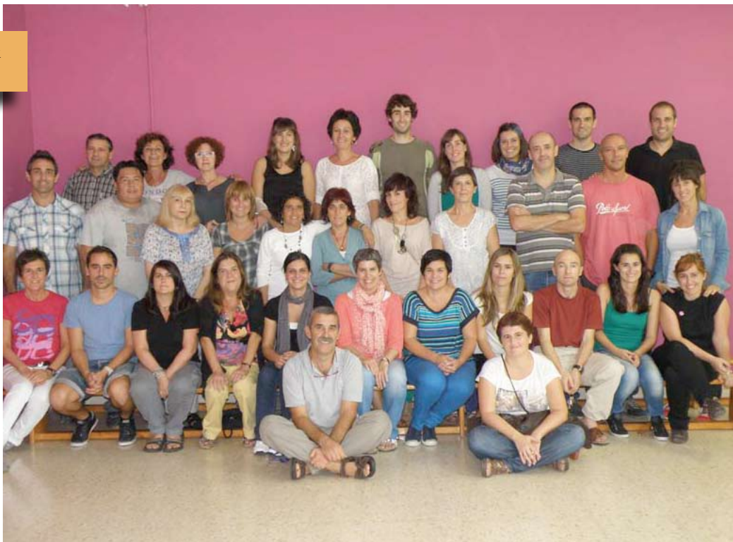
Eskolako langileak Personal del centro