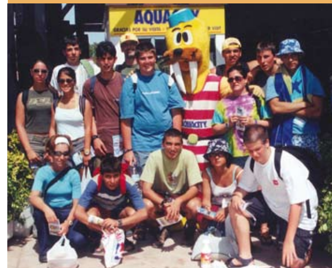
2000/01. DBH 4 Mallorkan. 2000/01. 4º de ESO en Mallorca.