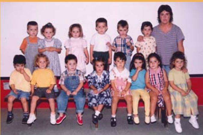
1997/98. Haur Hezkuntza, 3 urte. 1997/98. Educación Infantil, 3 años.