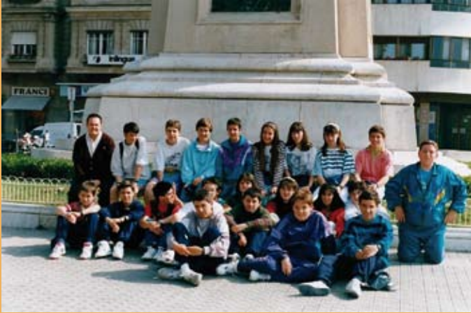
1990/91. OHOkoko 8. mailakoak Bartzelonan. 1990/91. 8º de EGB en Barcelona.

La financiación económica de la obra pasaba por encontrar una empresa que, a cambio de la construcción de garajes en los bajos del patio de recreo y su posterior venta, estuviera dispuesta a hacerse cargo de la reforma y ampliación del Colegio.