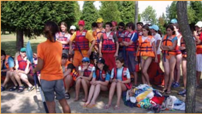
2005/06. Zuaza aterpetxean. 2005/06. En el albergue de Zuaza.