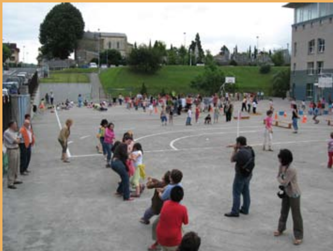
2006/07 ikasturtearen azken eguneko festa. Fiesta de fin de curso de 2006/07.

En este mismo curso se crea una Escuela de Formación Profesional en los bajos del Colegio. Tras cursar el Bachillerato Elemental, muchos jóvenes carecen de una oferta educativa en el barrio, adecuada a sus intereses. Esta escuela nace como respuesta a dicha necesidad, siendo la iniciativa acogida con interés por las empresas y talleres de la zona (Iriarte y Egaña y la Casa Thor), que contribuyen a su puesta en marcha con la donación de máquinas, torno, sierras e incluso una dependencia para la clase de taller de la escuela. El 3 de febrero de 1968, bajo la supervisión del profesor D. Jesús Mario Barbarín, queda inaugurada la Escuela de Formación Profesional.