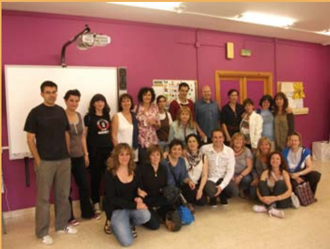
2009/10. Gurasoak adimen emozionaleko ikastaroan. 2009/10. Padres y madres en el curso de inteligencia emocional.

El minibús aprovechaba su recorrido para publicitar el Colegio por aquellas zonas de la ciudad que desconocían incluso su existencia. La apuesta resulta sumamente exitosa, ya que en el curso 1982/1983 el Colegio recibe 81 nuevas altas de alumnado, por lo que es necesaria la contratación de un servicio de transporte escolar externo que, junto con el minibús pionero en esta iniciativa, el cual siguió en funcionamiento durante dos cursos más, completaría dos itinerarios por diferentes barrios de la ciudad.