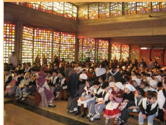
2010/11. Gabonak elizan. 2010/11. Navidades en la iglesia.

Bukatzeko, gauza bat azpimarratzea geratzen zait. Gure eskolaren eredu bakana da. Hemen, gura-soak garenez ikastetxearen “jabeak”, guk kudeatzen dugu, eta erabaki garrantzitsu guztietan parte hartzen dugu. Horrek egiten gaitu ezberdin eta bakan.