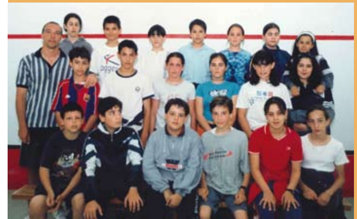
1998/99. Lehen Hezkuntzako 6. maila. 1998/99. 6º de Primaria.