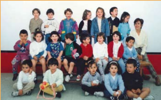
1998/99. Haur Hezkuntza, 3 urte. 1998/99. Educación Infantil, 3 años.