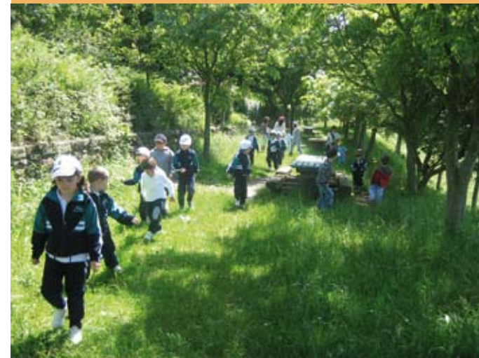
2006/07. Arrokandieta aterpetxean. 2006/07. En el albergue de Arrokandieta.

28 1973ko apirilaren 8an, eraikuntza lanak bukatuta, eta ikastetxeko altzari jende guztia jarrita, ikasleak erai-kin berrian sartu eta hirugarren hiruhilabeteko osoa bertan ikasi zuten. Altzarietan 425.238 pezeta gastatu zen, eta “José María Aristrain Jaun Txit Gorena” fundazioaren emaitza izan zen.