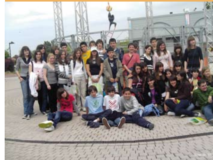
2007/08. Futuroscopen. 2007/08. En Futuroscope.