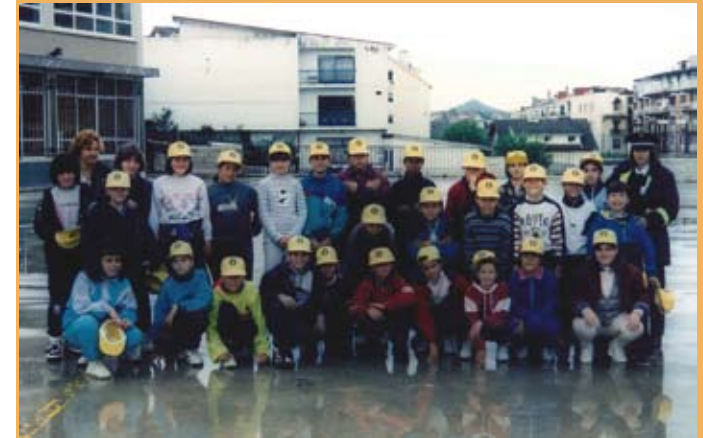
1994/95. OHoko 5. maila Bide Hezkuntzan. 1994/95. 5º de EGB en Educación Vial.