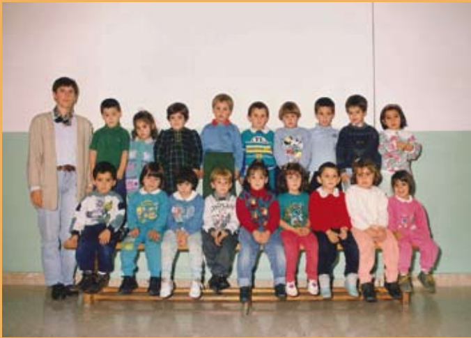
1994/95. Haur Hezkuntza, 4 urtekoen gela. 1994/95. Edicación Infantil, aula de 4 años.

Los dos cursos durante los que fue materializándose la obra resultaron complicados. El barro y el ruido de las máquinas se aliaron para complicar el normal desarrollo de la vida escolar. El profesorado tuvo que idear estrategias de lo más variado y original para sortear de la mejor manera posible las dificultades que iban surgiendo. Y no faltó quien ejerciese su docencia fuera del aula, en algún parque cercano, cuando las máquinas enmudecían su voz; eso sí, siempre que el tiempo acompañase.