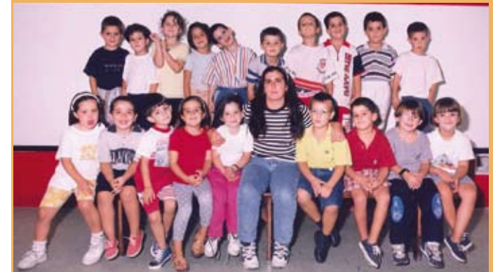
1997/98. Haur Hezkuntza, 5 urte. 1997/98. Educación Infantil, 5 años.