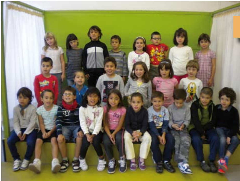
Lehen Hezkuntza 2 2º Primaria