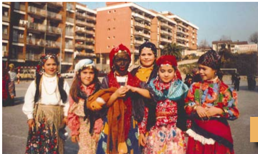
1989ko Ihauteria Carnaval de 1989