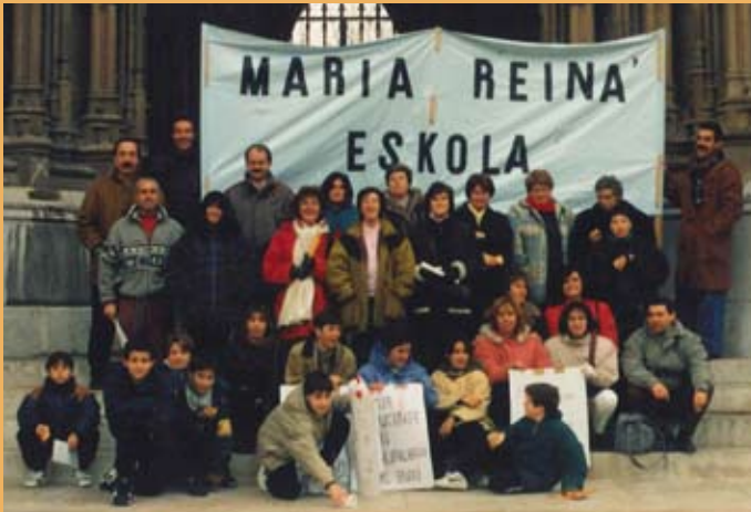
1995-12-30. Manifestazioa Eusko Legebiltzarraren aurrean, DBH lortzeko