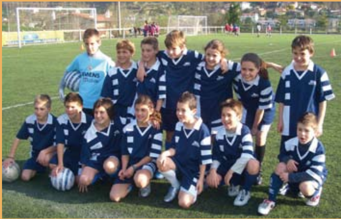
2005/06. Eskola kirola, txikiak. 2005/06. Deporte escolar, benjamines.