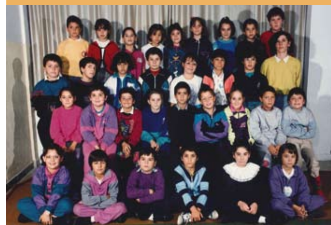
1990/91. OHoko 4. maila. 1990/91. 4º de EGB.