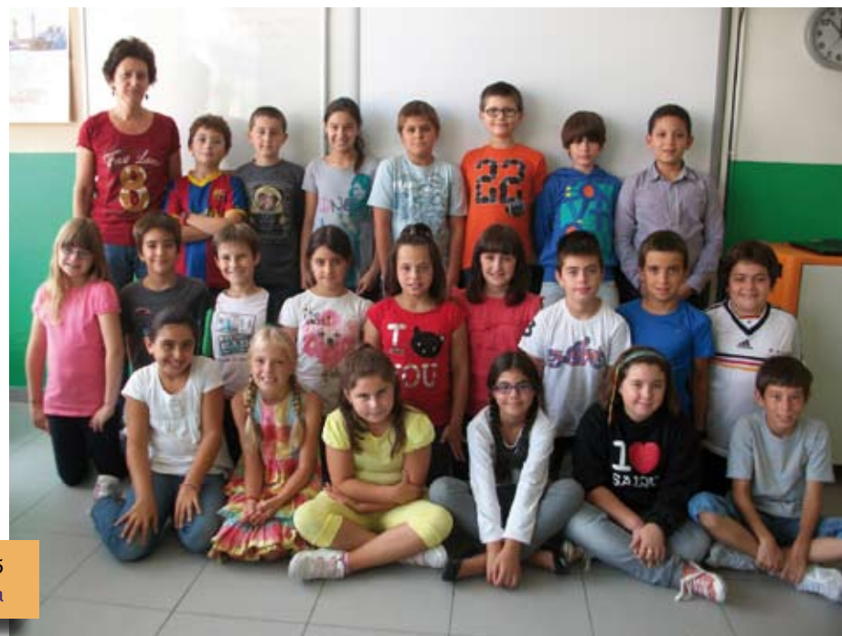
Lehen Hezkuntza 5 5º Primaria