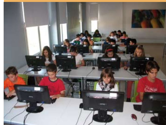
Informatika gela, gaur. Aula de Informática, hoy.