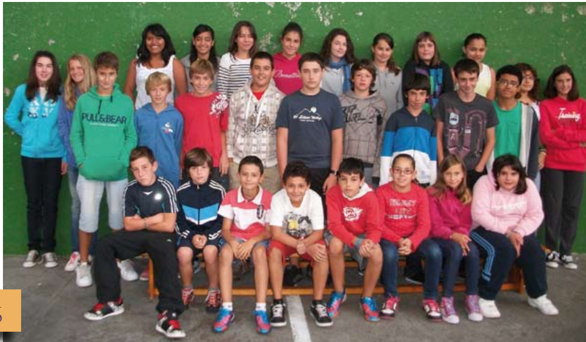
DBH 1 1º ESO