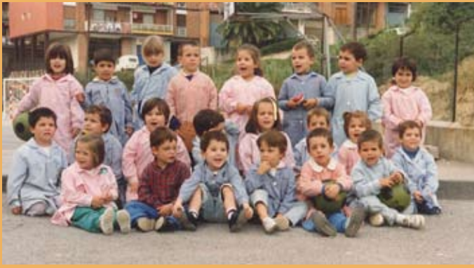
1989/90. Haur Hezkuntza, 5 urtekoen gela. 1989/90. Educación Infantil, aula de 5 años.

La situación de tranquilidad durante estos cursos va a dejar paso a unos años complicados para el Colegio. La nueva reforma de enseñanza se veía próxima. Una nueva etapa obligatoria haría su aparición: la ESO. María Reina no contaba, ni de lejos, con los requisitos necesarios que le permitiesen su implantación, lo que abocaría al centro a mantener solo la Educación Infantil y Primaria, con el consiguiente peligro para la supervivencia del Colegio.