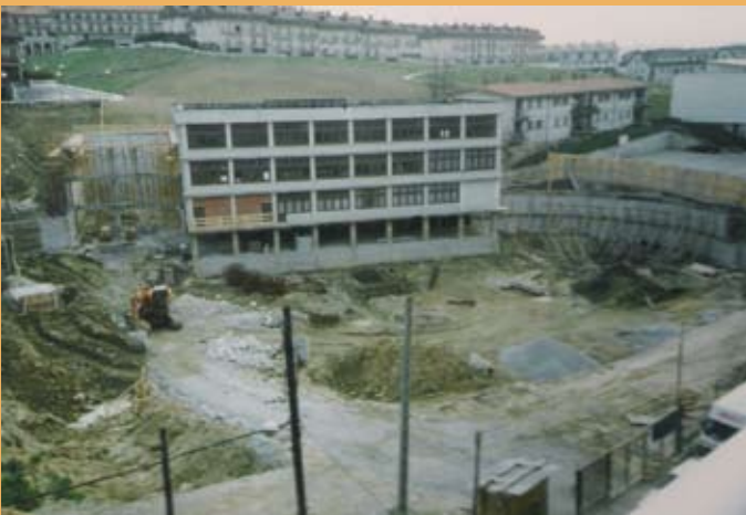
1992. Eskola berria eraikitzeke lanak. 1992. Obras de construcción del nuevo colegio.

Entre el 23 y el 28 de enero de este año se realiza el estudio geotécnico del subsuelo con el fin de garantizar que el terreno cumple las condiciones necesarias para acometer la obra.