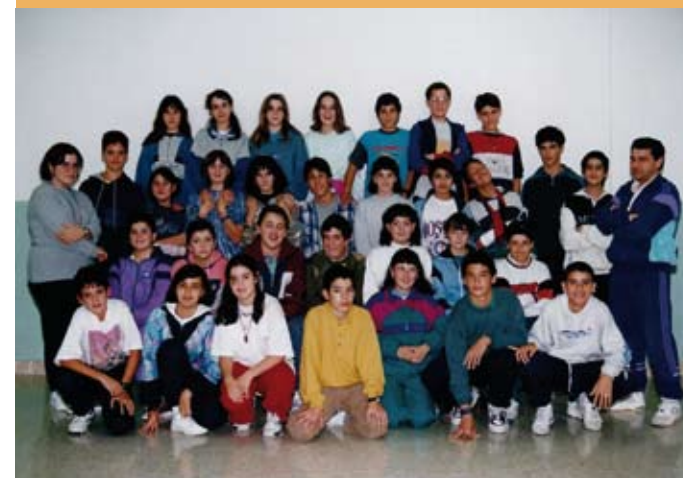
1994/95. OHoko 8. maila. 1994/95. 8° de EGB.