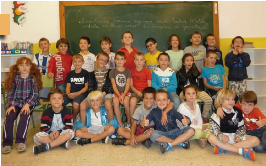
Lehen Hezkuntza 3 3º Primaria