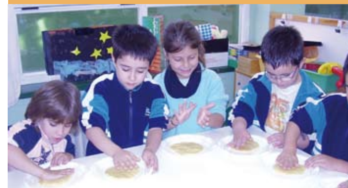
2006/07. Haur Hezkuntza, taloa egiten. 2006/07. Educación Infantil, haciendo talos.