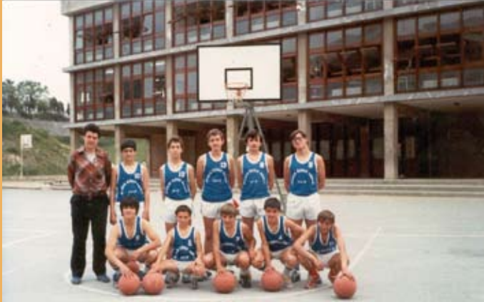
1982/83. Gipuzkoako txapeldunak. 1982/83. Campeones de Gipuzkoa.

En el curso 1981/1982 se pone en funcionamiento el servicio de transporte escolar. Partiendo del barrio de Beraun en Errenteria, y pasando por Pasaia, Altza, Larratxo e Intxaurren, recoge a unos 15 niños y niñas.