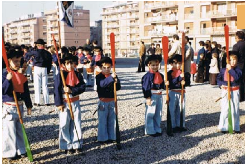
1984ko Danborrada Tamborrada de 1984