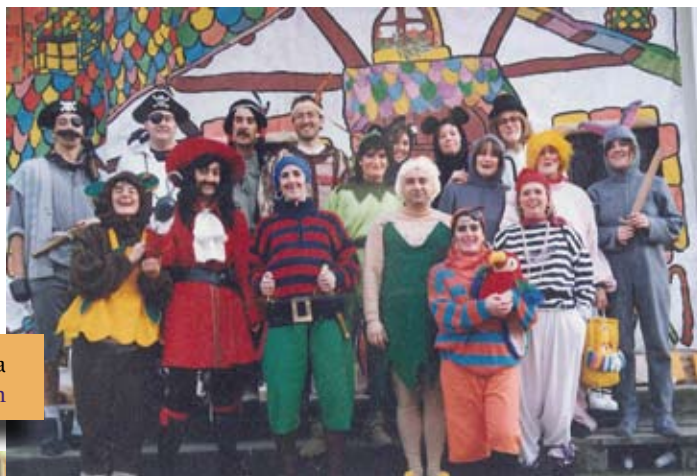
1992ko Ihauteria, Peter Pan ipuina Carnaval de 1992, cuento de Peter Pan