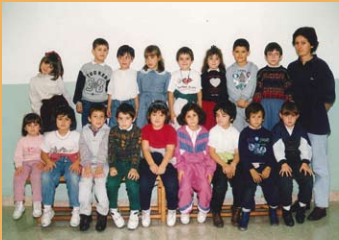
1994/95. OHoko 1. maila. 1994/95. 1º de EGB.

Oztopo guztiengatik ere, Maria Reina Eskolak bere erritmoari eutsi zion. Eta hori komunitate osoari esker lortu zen, nork beretik dena jarrita. Eskolak egun bakar batean itxi zituen atearak, eta hori segurtasun arazoak zirela medio.