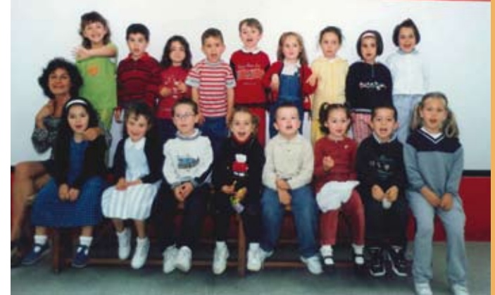
1998/99. Haur Hezkuntza, 4 urte. 1998/99. Educación Infantil, 4 años.

I2 1965eko maiatzaren 25ean, kontratu bat sinatu zen Maria Reina gizarte eta erlijio gunea izango zenaren orubeak eskuratzeko. Gune osoa 10 mila metro koa dro baino handiagoa zen.