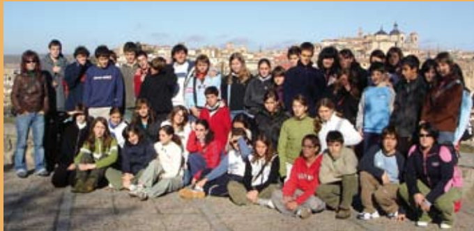
2006/07. Ávilan. 2006/07. En Ávila.