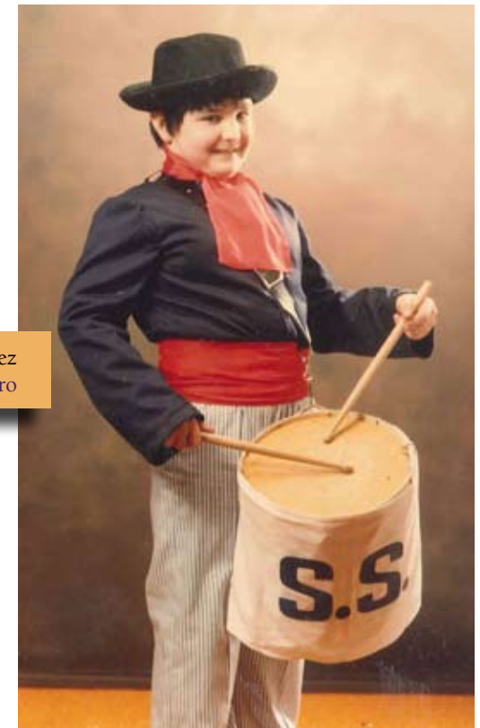
1985ko danbor-jotzailea, marinel jantzi zaharrez Tamborrero de 1985, con el antiguo traje de marinero