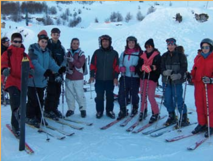
2005/06. Elurretan. 2005/06. En la nieve.

Hacia ya tiempo que la casa Almandoz de Arano, propiedad de María Reina Eskola, no se utilizaba como centro de colonias estivales. Tras varios intentos infructuosos de reflotarla y debido a su estado de abandono, el 31 de marzo de 1998 se decide su venta, que se hará efectiva el 24 de septiembre del mismo año por un total de 12.500.000 ptas. Con este dinero se financia, dos años después, la cubrición del frontón del Colegio, cuyo precio ascendió a 11.297.878 ptas.