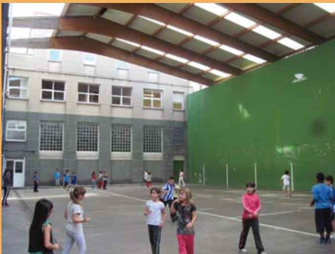
Frontoi estalkiduna. Frontón cubierto.