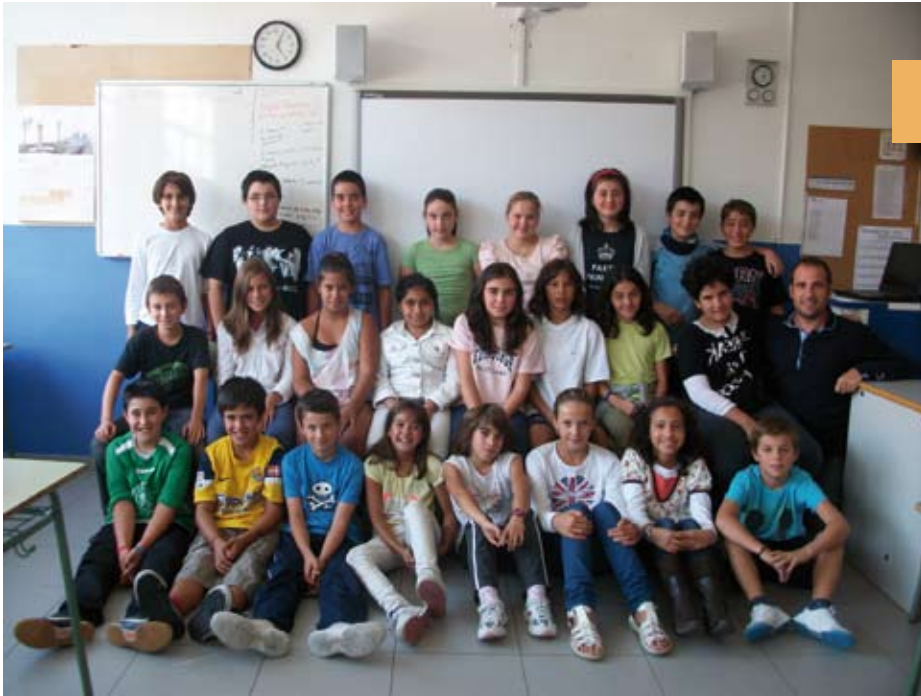
Lehen Hezkuntza 6 6º Primaria