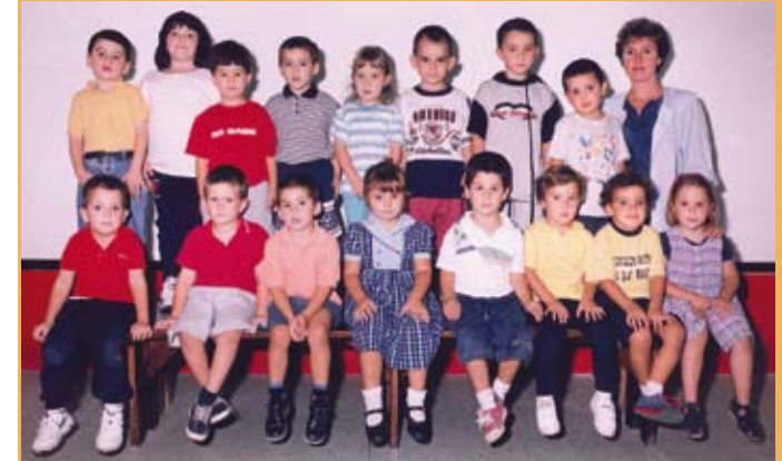
1997/98. Haur Hezkuntza, 4 urte. 1997/98. Educación Infantil, 4 años.

7. Lehen ikasturtea 1962ko urriaren 5ean zabaldu zen. 28 ikasle zituen eta bi ikasgela: 16 ikasle “Ingreso”n hasi ziren eta 12 batxilergoko lehen kurtsoan. Lehenago, irailaren 28an, eskolaren irekitzea eman zen jakitera, eta ikasturtea hasteko deia gutun baten bidez egin zen. Hona hemen gutun hori.