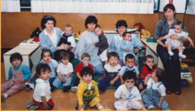
1998/99. Haur Hezkuntza, 0 eta 1 urte. 1998/99. Educación Infantil, 0 y 1 años.

El primer Claustro del Colegio María Reina estuvo compuesto en su totalidad, a excepción de un único docente, por sacerdotes. Todos ellos ejercieron su magisterio de forma totalmente altruista y gratuita. Esta fue la composición del Claustro.