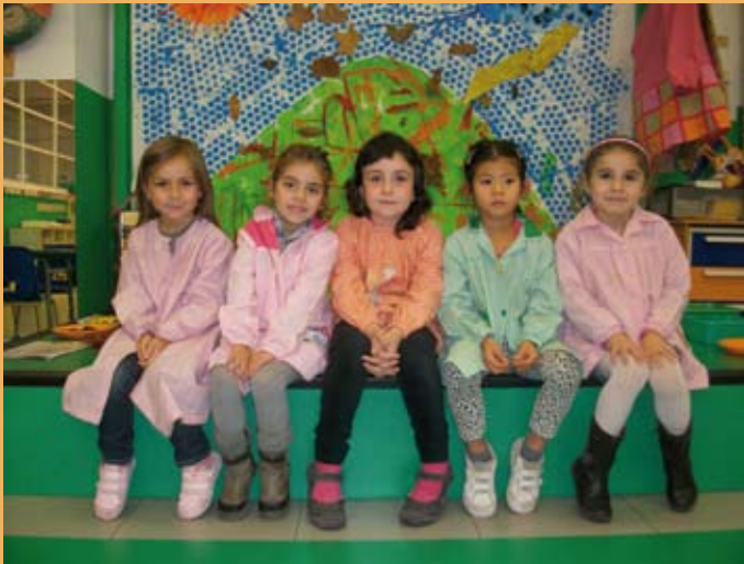
2012/13. HH5eko bost neskatxoak. 2012/13. Las cinco niñas de EI5.