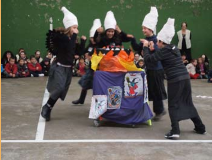
2012/13. Euskararen Eguna. 2012/13. Día del Euskera.

Entre estas apuestas educativas, cabe señalar la iniciativa que el Colegio pone en marcha en cuanto a la enseñanza del euskera. En este curso se comenzaron a impartir clases en este idioma, cuando su obligatoriedad llegaría con posterioridad.