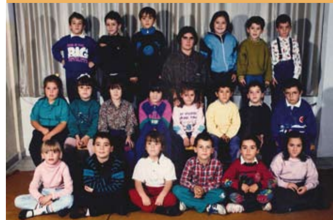
1990/91. OHoko 1. maila. 1990/91. 1º de EGB.

Aurreneko zuzemenak Donostiako Udaletxean egin ziren. Hona lehen hitzarmena: Eskolak jolas patioa lur zerrenda bat emango zion udaletxeari honek Ametzagaña etorbidearen jarraipena egiteko. Udaletxeak, ordez, Eskolaren atzealdean dagoen lur sail bat emango zion, etorkizunean frontoi bat eta gimnasio bat eraikitzeko.