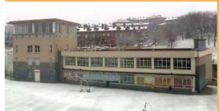
Eskola, elurtearen ondoren. El colegio, tras una nevada.