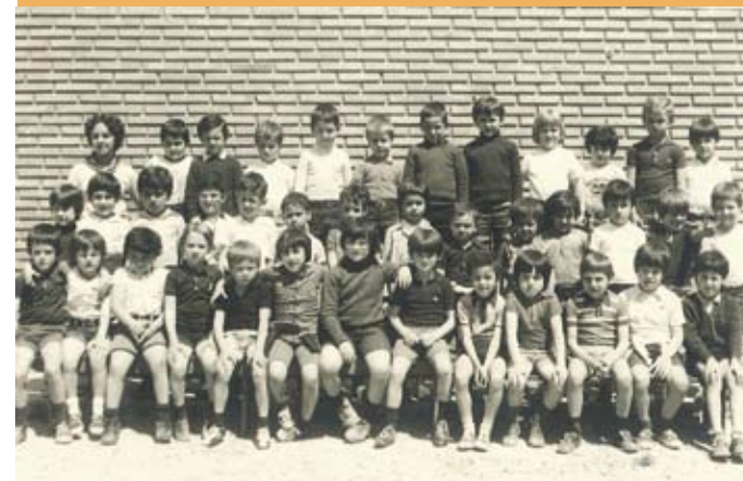
1974/75. Eskolaurrekoa. 1974/75. Preescolar.