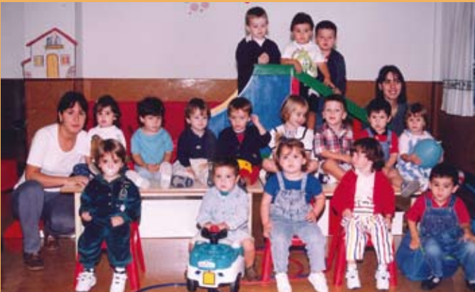
1997/98. Haur Hezkuntza, 2 urte. 1997/98. Educación Infantil, 2 años.