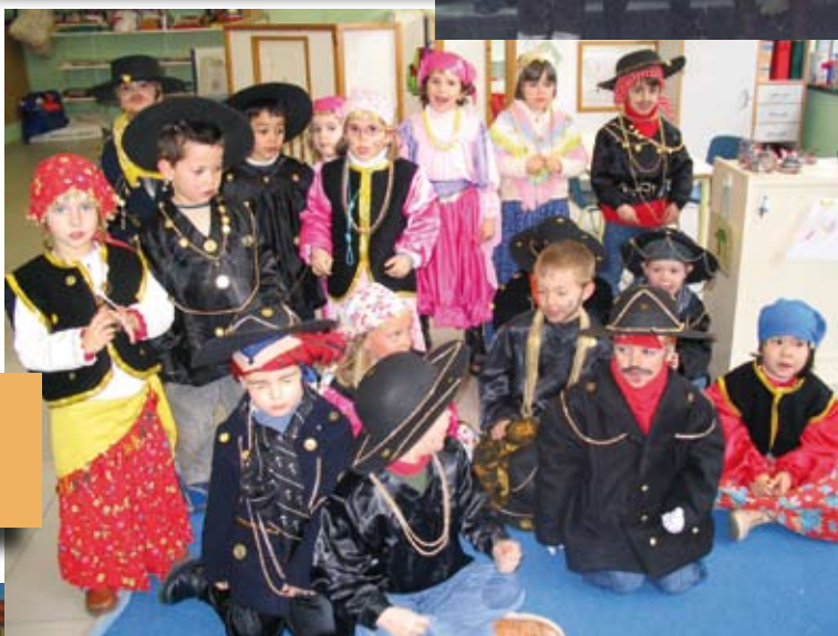
2005eko Kaldereroak Haur Hezkuntzan Caldereros de 2005 en Primaria