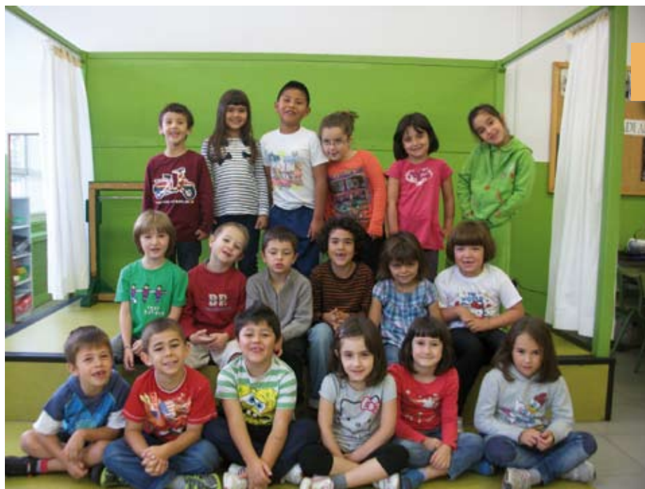
Lehen Hezkuntza 1 1º Primaria