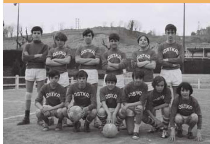
1970/71. Eskola kirola. Gipuzkoako txapeldunak. 1970/71. Deporte escolar. Campeones de Gipuzkoa.