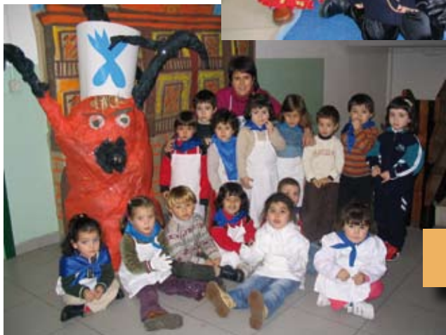
2005eko San Sebastian eguna Día de San Sebastián de 2005