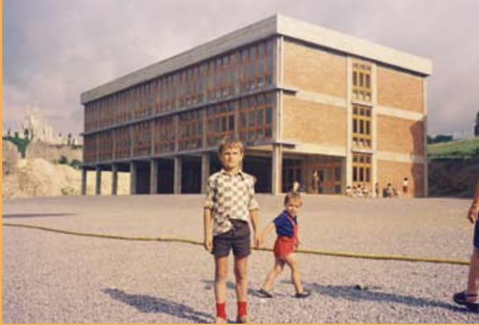
1972/73. Eskola berria. 1972/73. Nuevo colegio.