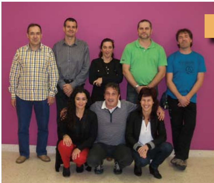
Gurasoen Batzordea gaur egun Actual Junta de Padres y Madres