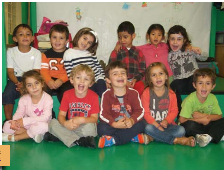
Haur Hezkuntza, 5 urte Educación infantil, 5 años