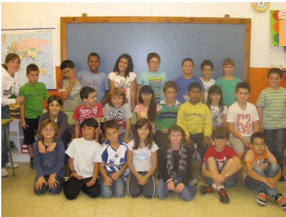
Lehen Hezkuntza 4 4º Primaria