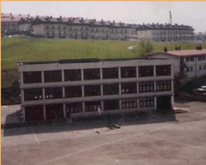
Eskolaren itxura 1988an, lanen aurretik. Aspecto del colegio en 1988, antes de la obra.