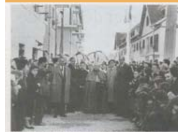
Seis parroquias donostiarras inician su andadura

3 Antzeko espiritu batekin sortu zen Xavier Kluba, baina haurren orde z gazte jendea zuen helburu, neska eta mutil. 1960an bazuten lokal bat Deba Ibaia kalean, 14. zenbakiko sotoetan. Bertako futbol taldeak, gero ko Kostkasen ernamuin, bere altxorren artean zeukan arauzko baloi bat eta bi elastiko joko, bata Errealarena eta bestea Athleticena.