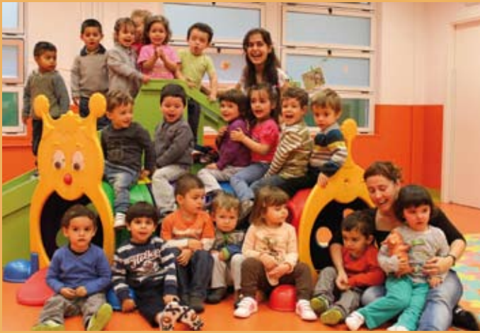
2011/12. 2 urtekoen gela. 2011/12. Aula de 2 años.