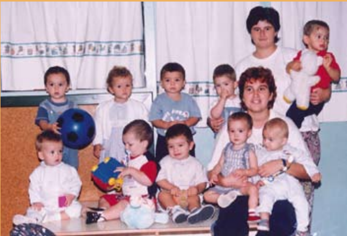
1997/98. Haur Hezkuntza, 0 eta 1 urte. 1997/98. Educación Infantil, 0 y 1 años.