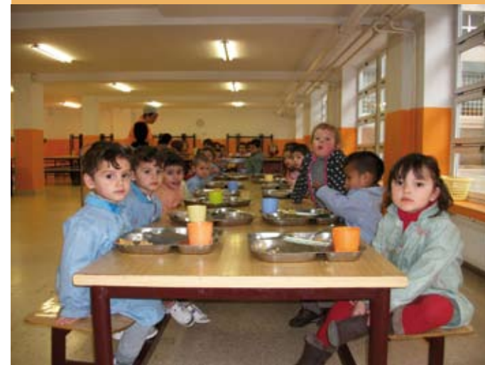
2012/13. Jangela. 2012/13. Comedor.