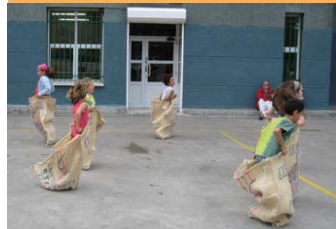
2006/07 ikasturtearen azken eguneko festa. Fiesta de fin de curso de 2006/07.

22 1968ko maiatzaren 30ean Maria Reina Eskolako Guraso Elkarte Katolikoak eskaera bat aurkeztu zuen eskola postu berriak sortzeko eskumendeko adar bat eraiki nahiz. 1969ko uztailaren 15ean Zientzia eta Hezkuntzako Ministerioak 450 eskola postu berri sortzeko kontzesioa izenpetu zuen. Postu berri horiek Maria Reina Parrokiako Guraso Elkarte Katolikoaren eskumendeko adarrean sortuko ziren. Dirulaguntza 4.320.000 pezetakoa zen, eta 480.000 pezetako aurreapena eman zen. Dirulaguntza horretan, 4.200.000 pezeta ez itzultzekoak dira eta 600.000 mailegutzat hartuak. Ikastetxean jaso ziren kontzesioaren jakinaraztea eta planoen onarpena, eta horiekin batera baldintza agiria eta Eraikuntzarako Kreditu Bankuan, gehienez hiru hileko epean, aurkeztu beharreko dokumentazioa. Arazo bat dago, ordea. Aipatutako banku horrek eskatzen du orubeak izan behar duela eskaera egiten duen erakundearen jabetzakoa. Eta orubearen jabetza Elizarena da.