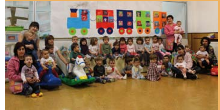
2011/12. Haurtzaindegia. 2011/12. Guardería.

Barealdiak izan dira, ekaitzaldiak ez gutxi, elkarri txanda hartuz ibili direnak ibilaldi luze honetan.