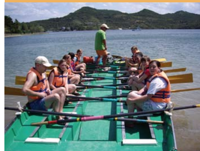
2006/07. Zuaza aterpetxean. 2006/07. En el albergue de Zuaza.