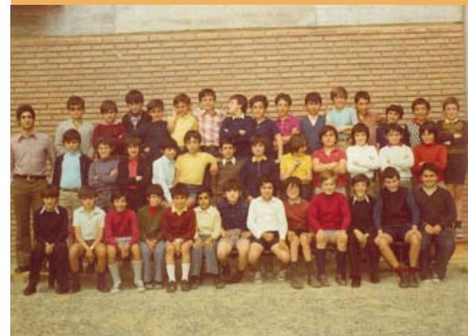
1974/75. OHoko 5. maila. 1974/75. 5º de EGB.