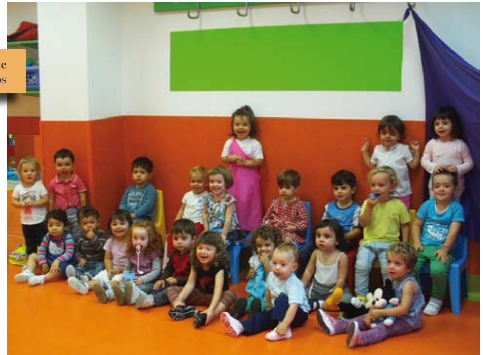
Haur Hezkuntza, 2 urte Educación infantil, 2 años