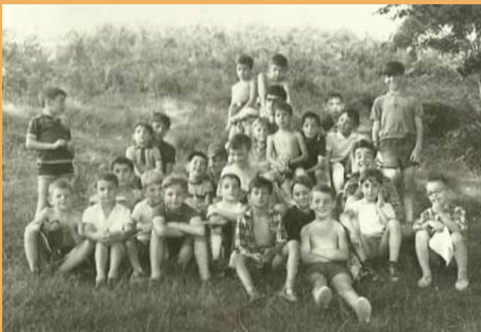
1968. Aranoko udalekuan. 1968. En las colonias de Arano.

El número de alumnos va aumentando progresivamente a lo largo de los años 60, ampliándose los niveles educativos del Primero de Bachillerato y el Ingreso del primer curso, con un total de 28 alumnos, a los 168 en el curso 65/66, repartidos en las clases de Preparatorio, Ingreso (desdoblado) y 1º, 2º y 3º de Bachillerato. En el curso 66/67, el Colegio va a dedicar una de sus partes a la Enseñanza Primaria. Se solicita y presenta la documentación para la creación de un grupo de párvulos y de una sección unitaria dependiente del Patronato Diocesano. Con fecha 5 de agosto de 1966, se publica en el Boletín Oficial del Ministerio de Educación la autorización de la implantación de estas dos secciones. Este curso el número de alumnos se cifra en 230.