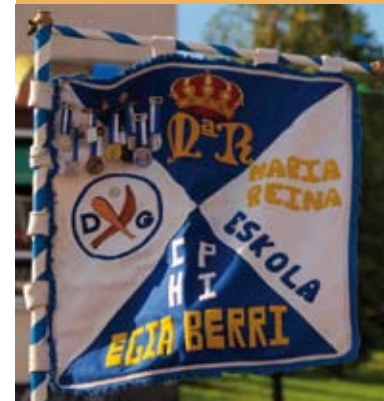
Danborrada. Bandera zaharra. Tamborrada. Antigua bandera.