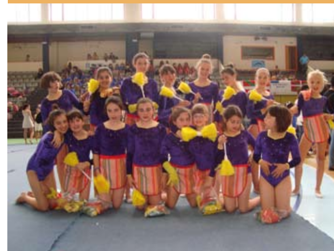
2009/10. Gimnastika erritmikoa. 2009/10. Gimnasia rítmica.