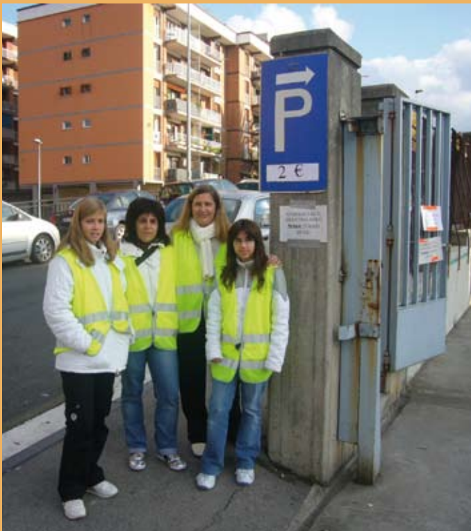
2007ko Santu Guztien Egunean, aparkalekua. Día de Todos los Santos de 2007, parking.