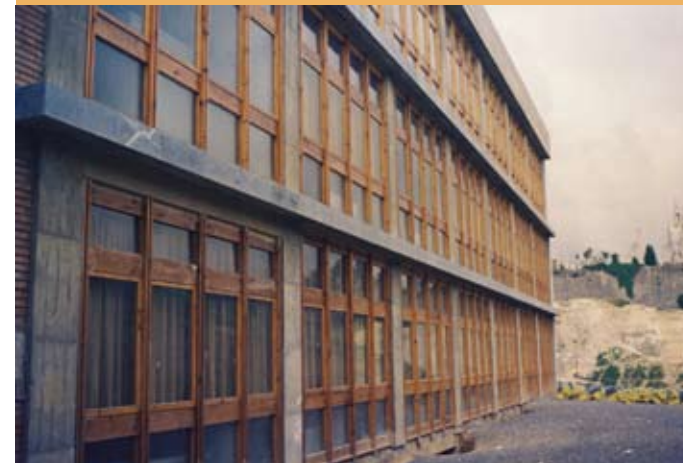
1972/73. Eskola berria atzetik, hesia jarri aurretik. 1972/73. Nuevo colegio por detrás, aún sin colocar la valla.