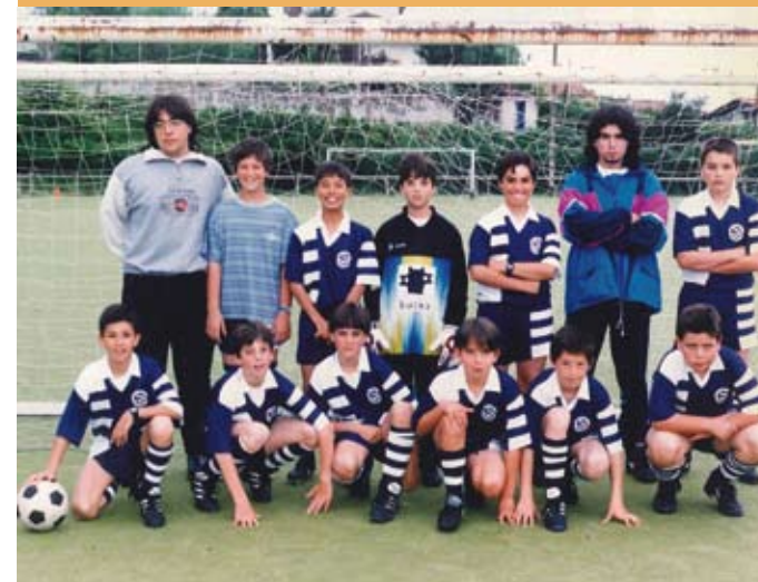
1997/98. DBH 2, eskola kirola. 1997/98. 2º de ESO, deporte escolar.