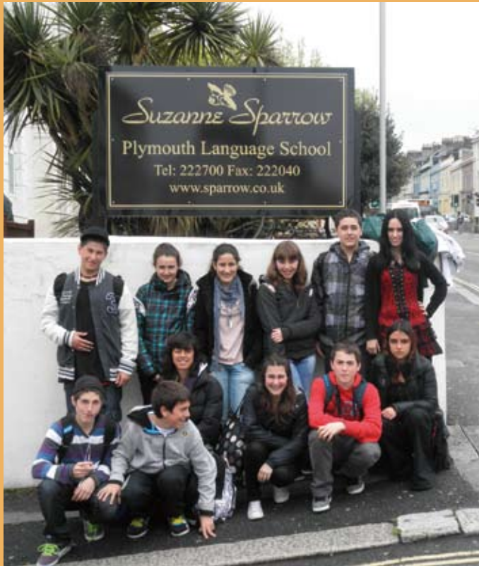
2010/11. Plymouthen, ingelesa ikasten. 2010/11. En Plymouth, aprendiendo inglés.