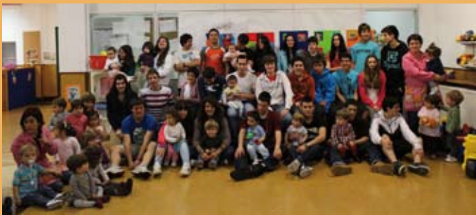
2011/12. 0-1 urte bitarteko eta DBH 4. kurtsoko ikasleak. 2011/12. Alumnado de 0-1 años y alumnado de 4º de ESO.

El 12 de abril de 1996, The English School – María Reina Eskola AIE pasa a tener la entidad jurídica que los facultará para la implantación de la ESO en ambos centros. Esta AIE quedará disuelta el 1 de septiembre de 2003, funcionando ya cada centro con su ESO de forma independiente.