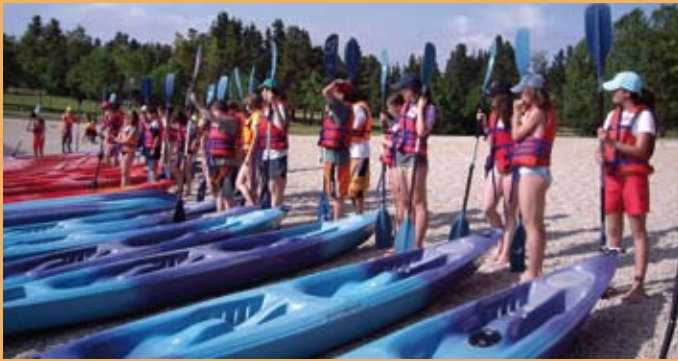
2005/06. Zuaza aterpetxean. 2005/06. En el albergue de Zuaza.